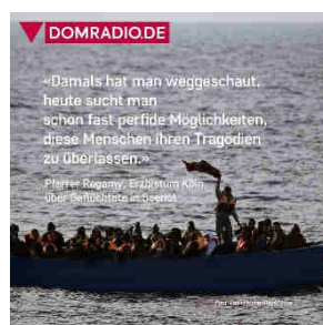
Post vom 07.07.2018