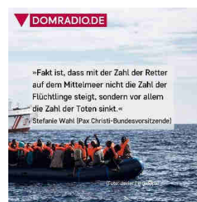
Post vom 08.11.2018