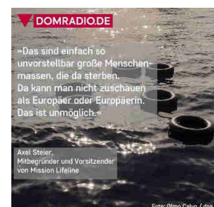
Post vom 30.12.2018