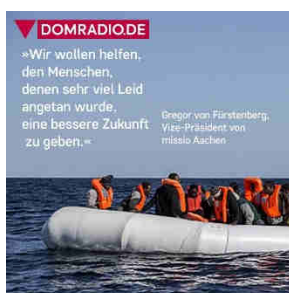
Post vom 20.06.2018